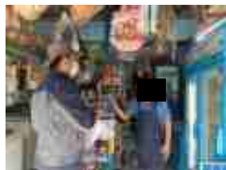
รูปที่ 2 ภาพแสดงการสำรวจความคิดเห็นตัวแทนผู้นำชุมชนในรัศมี 5 กิโลเมตร