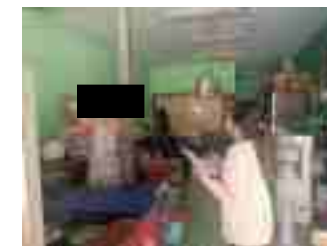
รูปที่ 3 ภาพแสดงการสำรวจความคิดเห็นตัวแทนครัวเรือนในรัศมี 5 กิโลเมตร