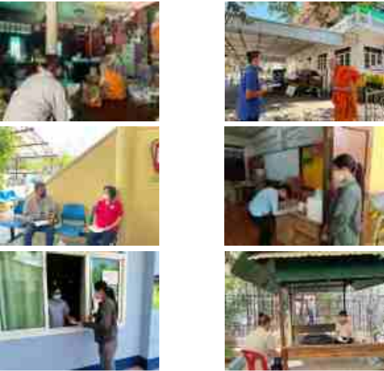
รูปที่ 1 ภาพแสดงการสำรวจความคิดเห็นตัวแทนพื้นที่อ่อนไหว/หน่วยงานราชการในรัศมี 5 กิโลเมตร

ผลการศึกษาสภาพเศรษฐกิจ สังคม และความคิดเห็น โครงการการขอเปลี่ยนแปลงผังและขนาดพื้นที่โรงงานหล่อเหล็กรูปพรรณ บริษัท โอชิน ทาคาโอก่า ฟาวนด์รี บางปะกง จำกัด ได้มีการสำรวจความคิดเห็นของประชาชน เมื่อวันที่ 27 - 31 ตุลาคม พ.ศ. 2567 ตามกลุ่มเป้าหมายแต่ละกลุ่ม โดยรอบพื้นที่ศึกษา บรรยายภาพการสำรวจความคิดเห็นแสดงดังรูปที่ 1 - รูปที่ 3 และสามารถสรุปผลการสำรวจและความคิดเห็น ได้ดังนี้